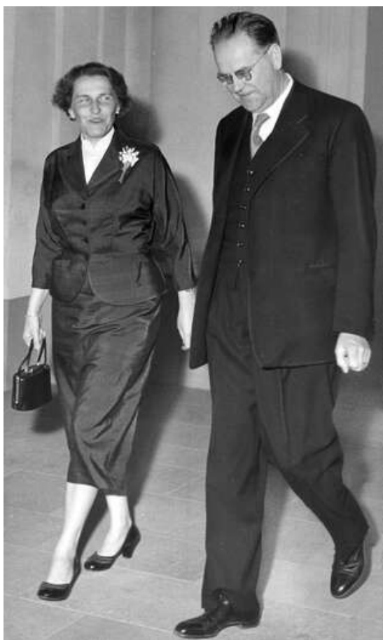
Ulla Lindström och Tage Erlander