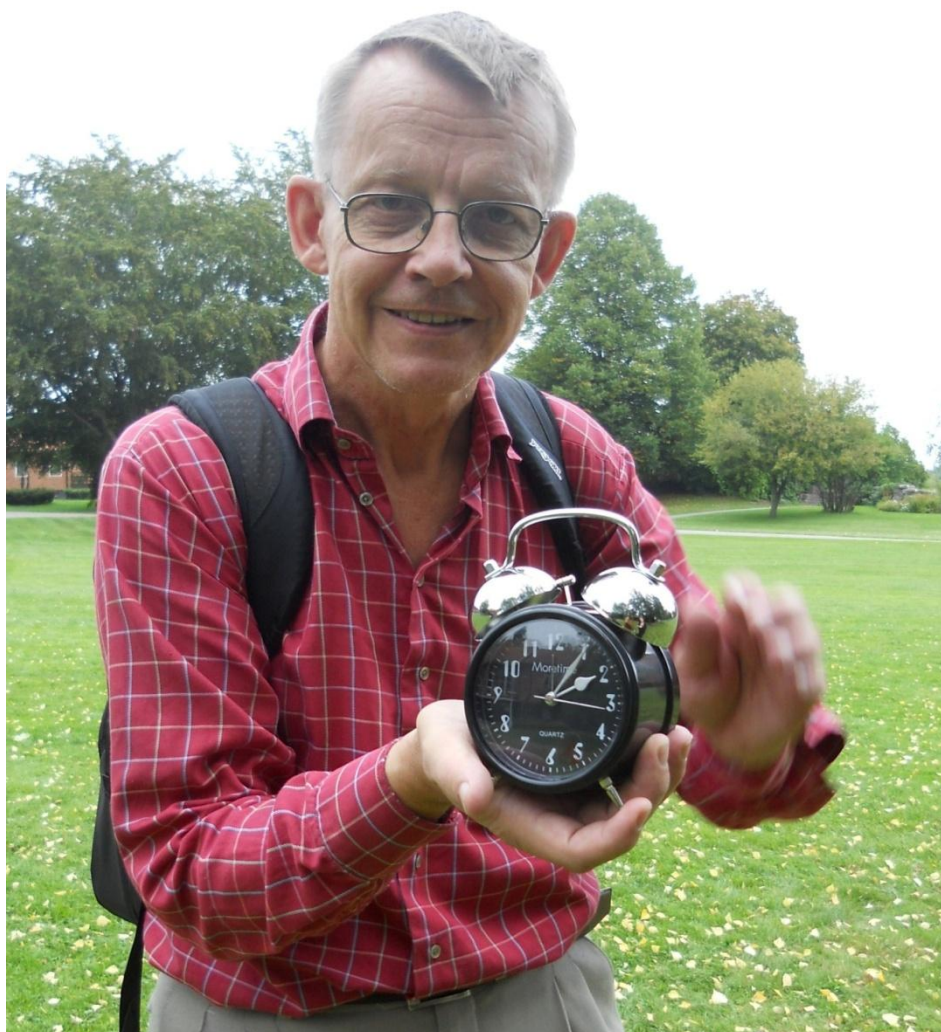
Årets Väckarklocka 2011 Stiftelsen Gapminder och initiativtagaren Hans Rosling