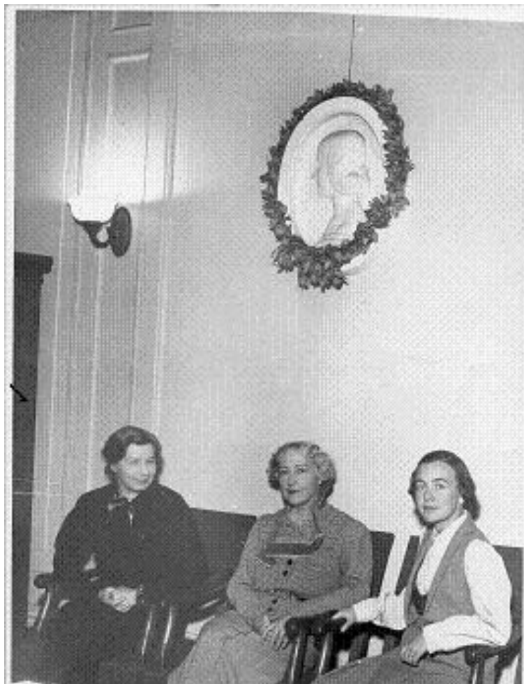
Tre ledamöter i Samfundet De Nio, Elin Wägner (stol nr 2), Marika Stiernstedt (stol nr 8) och Karin Boye (stol nr 6)